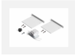
04-00101, W 2xEndkappe - Metall, Klemmleiste 5-polig, Kabeldurchführung